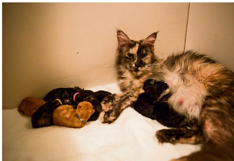
NIBARNSMOR: Søndag fekk Bermuda ni kattungar. Dermed blir det kamp om dei åtte spenene. For å sikre at alle klarer seg gir Sissel ekstra morsmjølkerstatning.