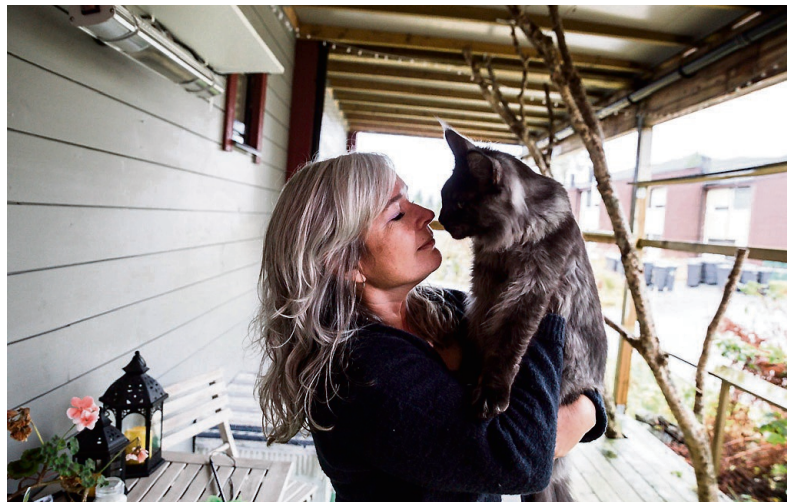
PRISVINNAR: Gattacamoon X-Man JW blei fødd i mars og kjem frå Estland. - Eg henta han i Wien. Han er kattungen min, sjølv om han ikkje akkurat ser slik ut, stor som han er.